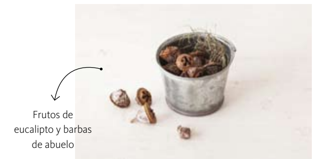
Frutos de eucalipto y barbas de abuelo