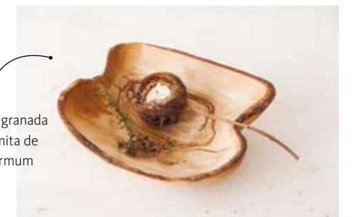
Cáscara de granada seca y ramita de leptospermum